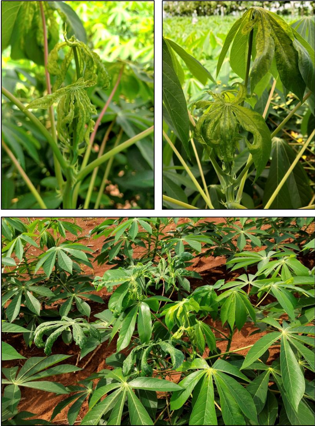
ภาพที่ 6 (ต่อ)