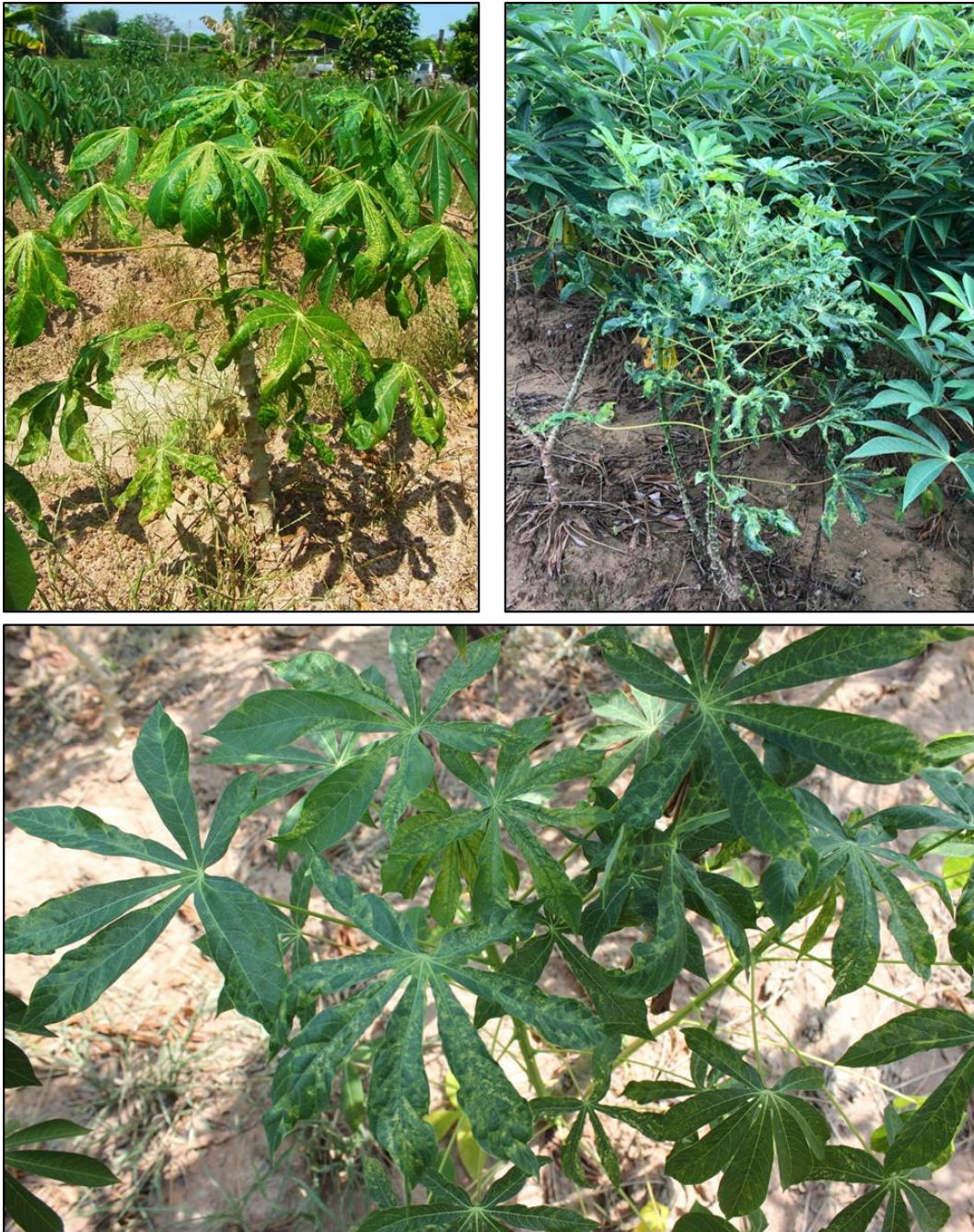
ภาพที่ 5 ใบมันสำปะหลังที่แสดงอาการใบต่างจากท่อนพันธุ์หรือเหง้า แสดงอาการใบต่างสีเขียวอ่อนหรือเหลืองสลับเขียวเข้ม ใบหงิกงอ และเสียรูปทรงทั่วทั้งต้น

2. อาการบนใบแก่และลำต้น ใบมันสำปะหลังที่ถัดลงมาจากไปยอดจะแสดงอาการอาการต่างหรือเหลืองสลับเขียวเข้ม ซึ่งอาการใบต่างจะเห็นได้ชัดทุกใบทั่วทั้งลำต้น และต้นมันที่เป็นโรคจะแคระแกร็นกว่าต้นมันปกติ (ภาพที่ 5)