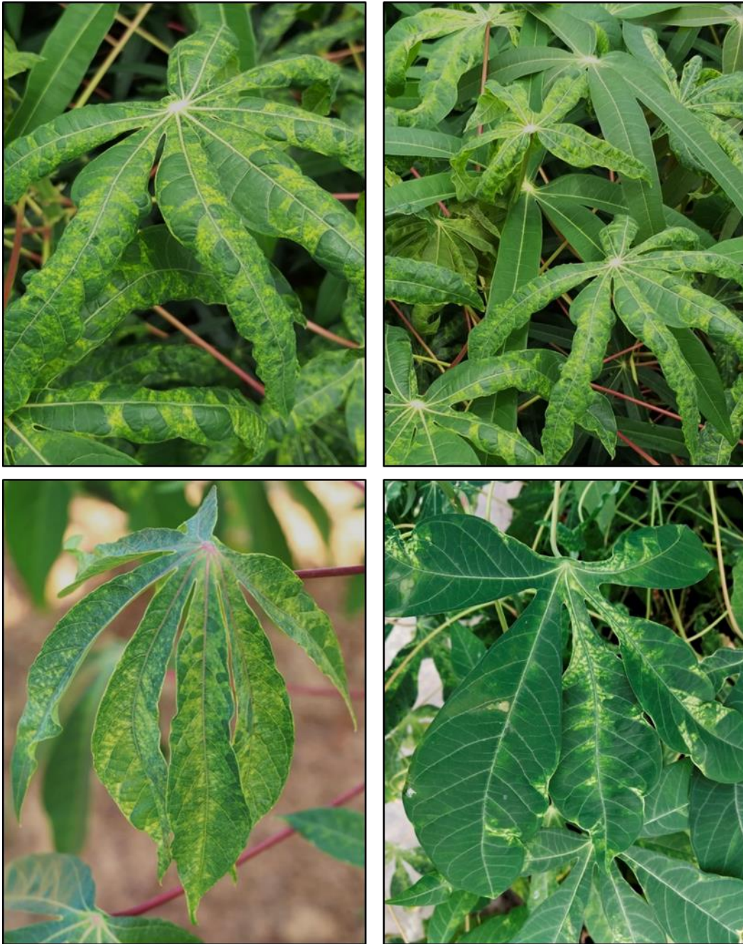
ภาพที่ 3 ใบมันสำปะหลังที่แสดงอาการต่างเขียวอ่อนหรือเหลืองสลับเขียวเข้ม มีขนาดเรียวยเล็ก หงิกงอ และเสียรูปทรง

2. ลักษณะอาการบนใบ ส่วนใบที่ถัดลงมาจายอดหรือใบแก่จะพบอาการต่างเขียวอ่อนหรือเหลืองสลับเขียวเข้ม หงิกงอ และเสียรูปทรง (ภาพที่ 3)