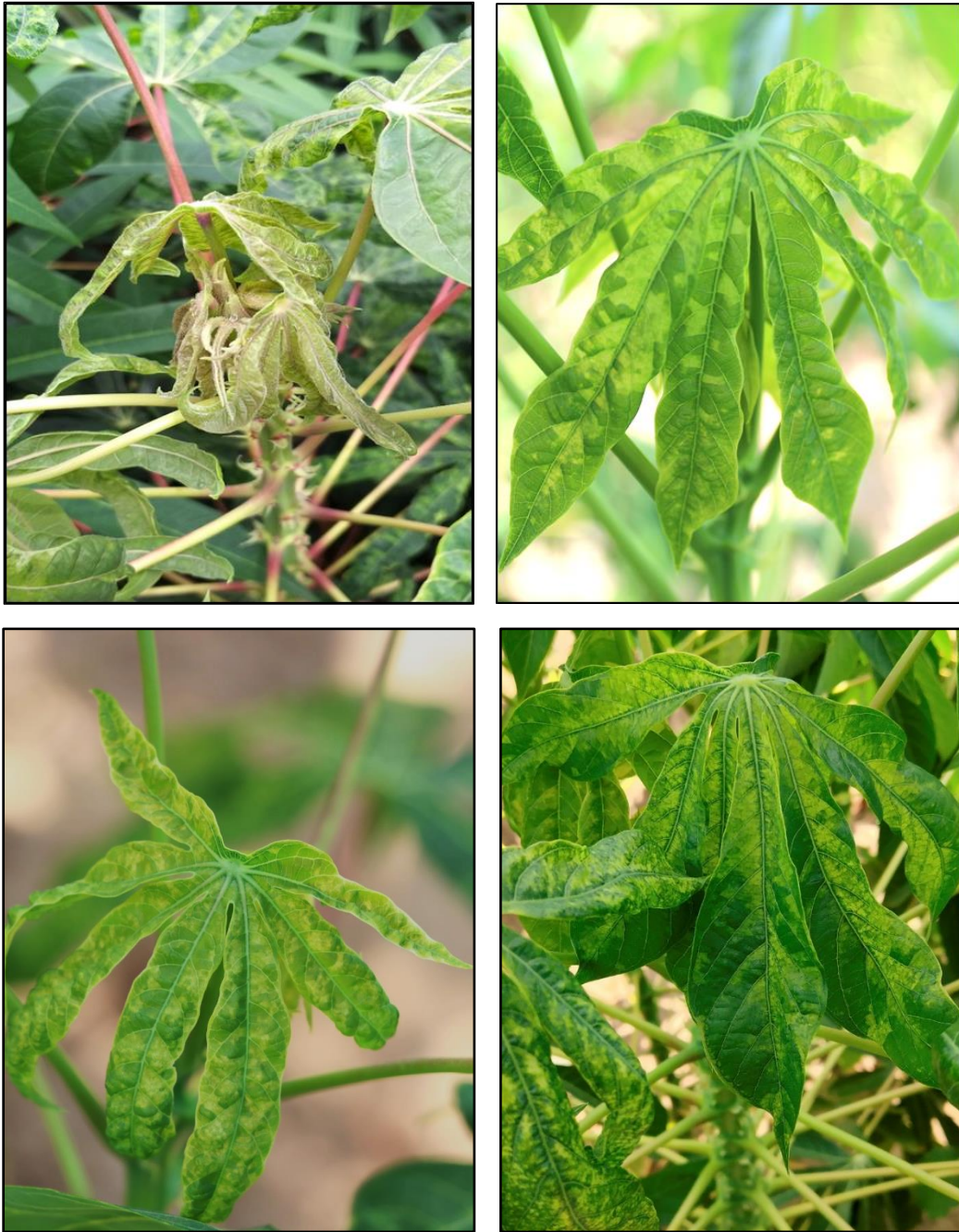
ภาพที่ 2 ยอดอ่อนหรือยอดที่เกิดใหม่จะแสดงอาการต่างเขียวอ่อนหรือเหลืองสลับเขียวเข้ม มีขนาดเล็ก หงิกงอและเสีรูปทรง

1. ลักษณะอาการบนยอด ส่วนของยอดอ่อนหรือยอดที่เกิดใหม่จะแสดงอาการต่างเขียวอ่อนหรือเหลือง สลับเขียวเข้ม มีขนาดเล็ก หงิกงอ และเสีรูปทรง (ภาพที่ 2)