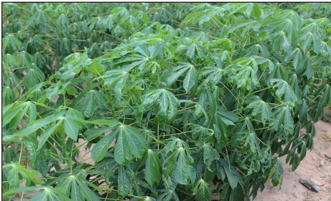
ภาพที่ 1 สภาพแปลงปลูกมันสำปะหลังที่เป็นโรคใบด่างมันสำปะหลังที่พบการเกิดโรคทั้งที่มาจากท่อนพันธุ์และที่เกิดโรคจากแมลงหริ้วขาวยาสูบ

การแพร่ระบาดของโรคใบด่างมันสำปะหลังเกิดได้จากการนำท่อนพันธุ์มันสำปะหลังที่เป็นโรคมานำปลูกทำให้ต้นมันสำปะหลังที่งอกมาใหม่เป็นโรค ประกอบกับในแปลงปลูกในสำปะหลังมีแมลงหริ้วขาวยาสูบซึ่งเป็นพาหะที่ดูดกินน้ำเลี้ยงต้นมันสำปะหลังที่เป็นโรคไปสู่ต้นมันสำปะหลังปกติจึงทำให้ต้นปกติเป็นโรค โดยในแปลงมันสำปะหลังมักจะพบการเกิดโรคทั้งที่มาจากท่อนพันธุ์และที่เกิดโรคจากแมลงหริ้วขาวยาสูบ (ภาพที่ 1)