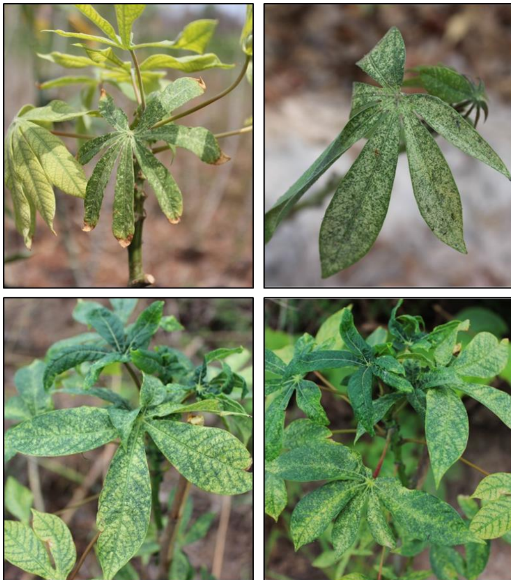
ภาพที่ 9 ลักษณะใบมันสำปะหลังแสดงอาการคล้ายโรคใบด่างมันสำปะหลังที่เกิดจากการเข้าทำลายของไรแดง

2. อาการที่เกิดจากไรแดง ใบมันสำปะหลังที่ถูกไรแดงดูดกินน้ำเลี้ยงจะมีอาการดประสีเหลืองหรือขีดขนาดเล็กซึ่งเกิดจากการดูดกินน้ำเลี้ยงกระจายอยู่ทั่วแผ่นใบ ซึ่งมีลักษณะคล้ายกับอาการโรคใบด่างมันสำปะหลัง (ภาพที่ 9)