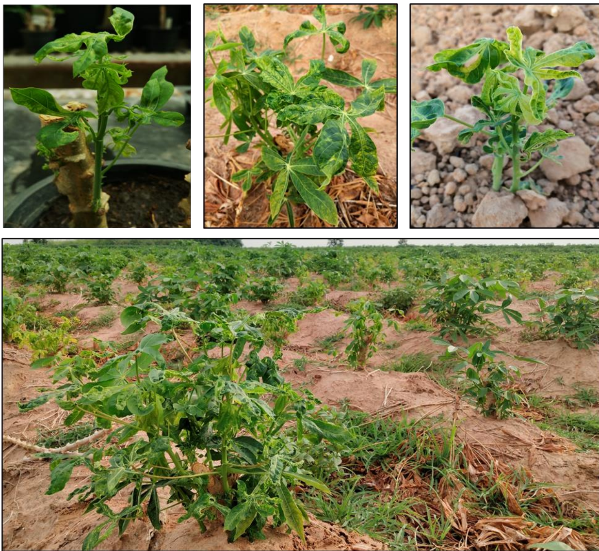
ภาพที่ 4 ยอดและใบที่แตกหรือเกิดมาใหม่จากท่อนพันธุ์หรือเหง้า แสดงอาการใบด่างสีเขียวอ่อนหรือเหลืองสลับเขียวเข้ม ใบหงิกงอ และเสีयरูปทรงตั้งแต่เริ่มงอก

1. อาการบนยอดหรือส่วนที่งอกใหม่ ยอดและใบที่แตกหรือเกิดมาใหม่จะแสดงอาการใบด่างสีเขียวเข้ม สลับเขียวอ่อน หรือสีเขียวสลับสีเหลือง ใบหงิกงอ และเสีयरูปทรงตั้งแต่เริ่มงอก (ภาพที่ 4)