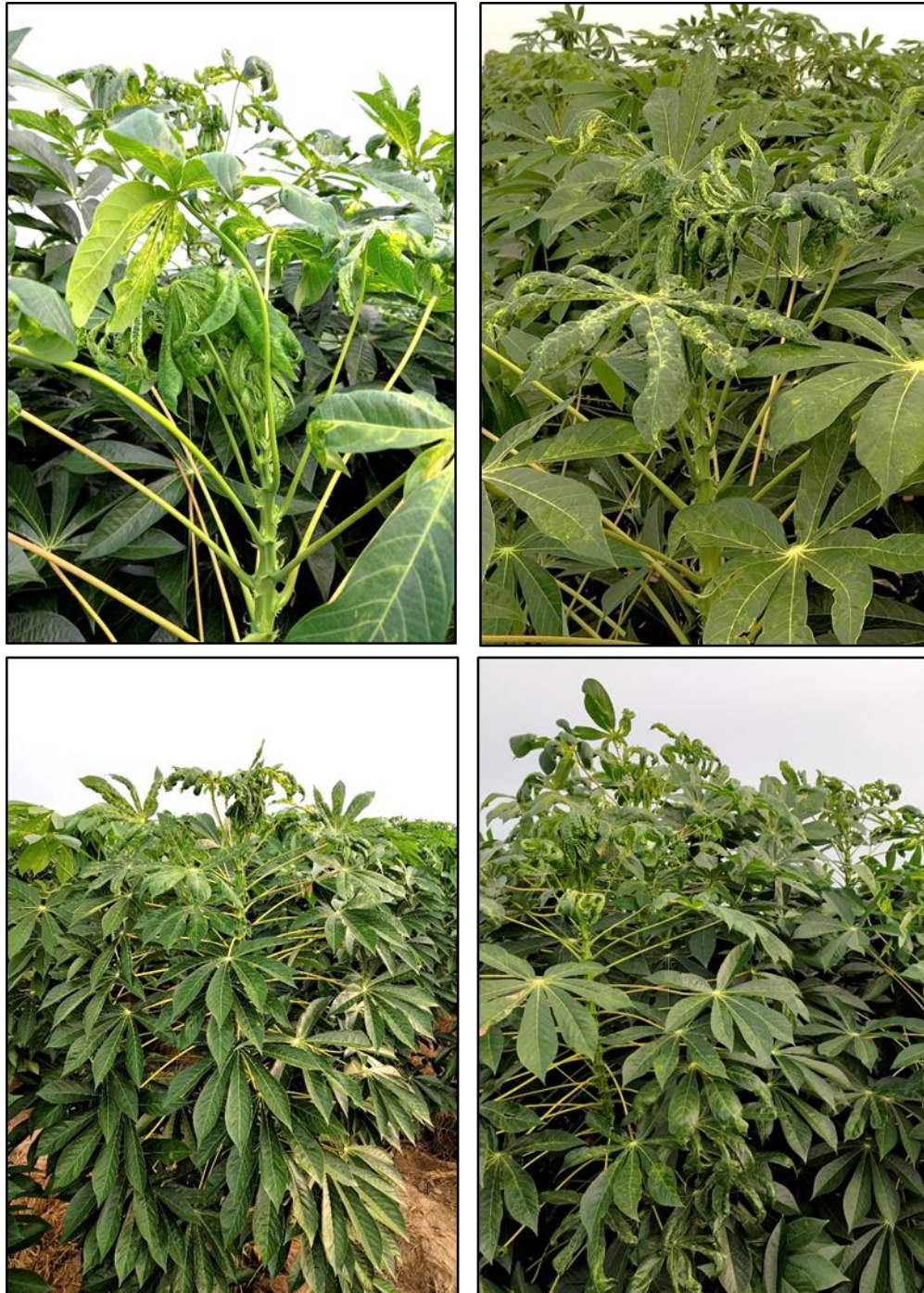
ภาพที่ 7 โรคใบต่างที่ถ่ายทอดโรคด้วยแมลงหริ้วขาวยาสูบ บริเวณไบยอดและใบล่างที่ถัดลงมาจากยอดของต้นมันสำปะหลังที่ลงหัวแล้วหรืออายุมาก

2. อาการในต้นมันสำปะหลังที่ลงหัวแล้วหรืออายุมาก การพัฒนาการของโรคจะคล้ายกับต้นมันสำปะหลังที่ยังเล็กโดยหลังจากที่ต้นมันสำปะหลังได้รับเชื้อจากแมลงหริ้วขาว ไบยอดจะเริ่มแสดงอาการซีดหรือต่าง จากนั้นใบล่างที่ถัดลงมาจากยอดจึงจะแสดงอาการใบต่าง (ภาพที่ 7)