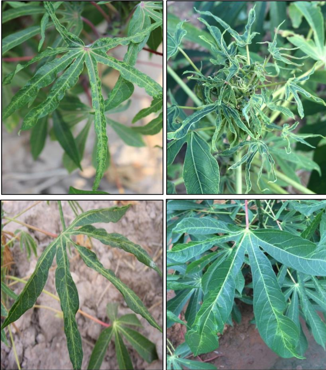
ภาพที่ 8 ใบมันสำปะหลังจะมีลักษณะอาการผิดปกติคล้ายโรคใบด่างมันสำปะหลังที่เกิดจากการถูกสารเคมี ยอดและใบเรียวเล็ก เนื้อใบหนาและแข็ง

1. อาการผิดปกติเนื่องจากถูกสารเคมี จะมีลักษณะคล้ายกับอาการที่เกิดจากเชื้อไวรัสใบด่างมันสำปะหลังจะพบว่าใบมันสำปะหลังมีลักษณะเรียวเล็ก ลดรูป เนื้อใบมีสีเขียวอ่อนสลับเขียวเข้ม แต่เนื้อใบจะมีลักษณะที่แข็งและหนา (ภาพที่ 8)