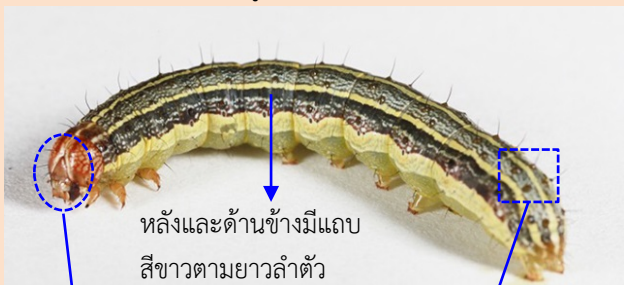
หลังและด้านข้างมีแถบสีขาวตามยาวลำตัว

ระยะหนอน ส่วนบนของหัวมีแถบสีขาวเป็นรูปตัว Y หัวกลับ หลังและด้านข้างมีแถบสีขาวตามยาวลำตัว ปล้องท้องก่อนปล้องสุดท้ายมีจุดสีดำ 4 จุด รูปร่างสี่เหลี่ยมจัตุรัส ตัวเต็มวัยมีขนาด 3.2-4.0 ซม. มีแถบสีขาวที่ขอบปีกคู่หน้า กลางปีกมีแถบลักษณะเป็นวงรีสีน้ำตาล เพศเมียมีสีและลวดลายจางกว่าเพศผู้