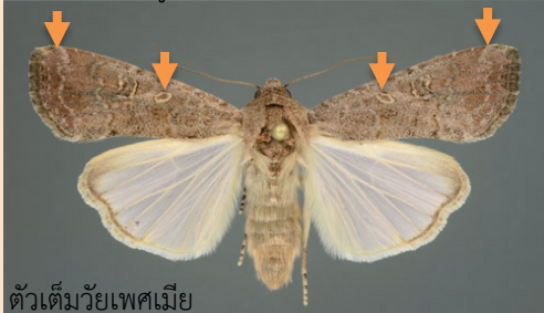
ตัวเต็มวัยเพศเมีย