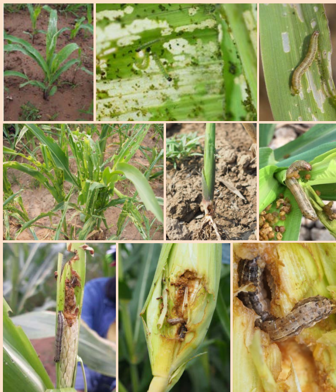
ภาพ การทำลายข้าวโพดของหนอนกระทู้ fall armyworm