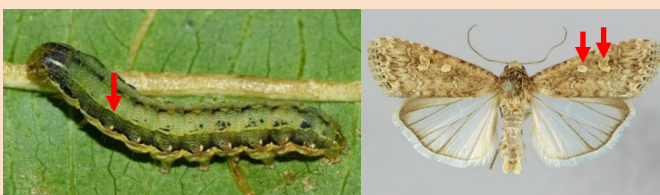
หนอนกระทู้หอม : beet armyworm ( Spodoptera exigua (Hübner))

ระยะหนอน ออกปล้องที่ 2 และ 3 มีจุดสีเหลืองปล้องละ 2 จุด ออกปล้องที่ 3 มีปื้นสีดำขนาดใหญ่ที่ตอนท้ายของปล้อง ตัวเต็มวัยปีกคู่หน้ามีเส้นสีเหลืองพาดขวางกลางปีก