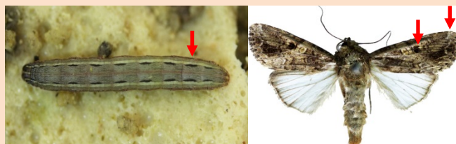
หนอนกระทู้กัลลา : lawn armyworm ( Spodoptera Mauritii (Boisduval))

ระยะหนอน ส่วนบนของหัวมีแถบสีขาวเป็นรูปตัว Y หัวกลับ หลังและด้านข้างมีแถบสีขาวตามยาวลำตัว ปล้องท้องก่อนปล้องสุดท้ายมีจุดสีดำ 4 จุด เรียงตัวรูปสี่เหลี่ยมจัตุรัส ตัวเต็มวัย ปีกคู่หน้ามีแถบสีขาวที่ขอบปีก