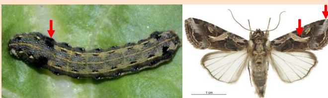
หนอนกระทู้ผัก : common cutworm ( Spodoptera litura (Fabricius))

ระยะหนอน กลางหลังมีแถบสีดำปล้องละ 2 แถบเห็นได้ชัดเจน ด้านข้างมีแถบสีน้ำตาลตลอดความยาวลำตัว ออกปล้องที่ 2 และ 3 ไม่มีจุดสีเหลือง ออกปล้องที่ 3 ไม่มีปื้นสีดำ ตัวเต็มวัย แถบสีขาวที่ขอบปีกคู่หน้าหายเป็นคลื่น กลางปีกมีจุดกลมสีดำ