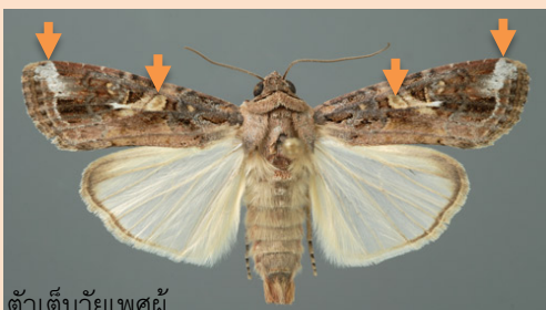
ตัวเต็มวัยเพศผู้