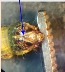
รูปตัว Y หัวกลับสีขาว