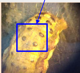
จุดสีดำ 4 จุด รูปร่างสี่เหลี่ยมจัตุรัส