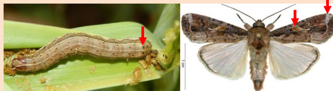
หนอนกระทู้ข้าวโพดลายจุด : fall armyworm ( Spodoptera frugiperda (J.E. Smith))

ระยะหนอน ส่วนบนของหัวมีแถบสีขาวเป็นรูปตัว Y หัวกลับ หลังและด้านข้างมีแถบสีขาวตามยาวลำตัว ปล้องท้องก่อนปล้องสุดท้ายมีจุดสีดำ 4 จุด เรียงตัวรูปสี่เหลี่ยมจัตุรัส ตัวเต็มวัย ปีกคู่หน้ามีแถบสีขาวที่ขอบปีก