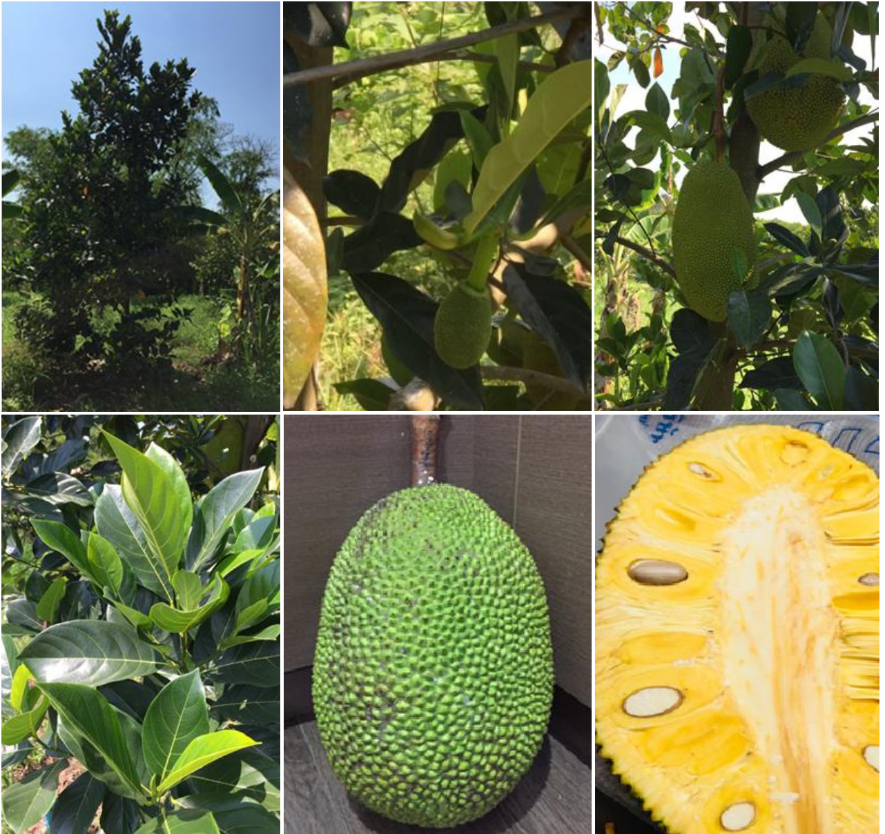
ขนุนพันธุ์ชนาธิป