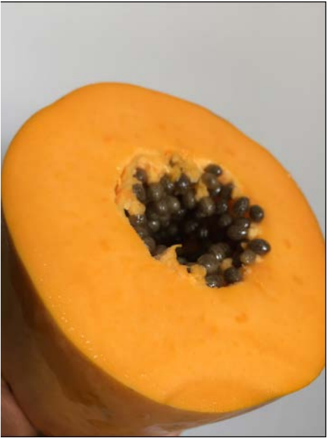
มะละกอ พันธุ์ฮันนีมูน (Honeymoon)