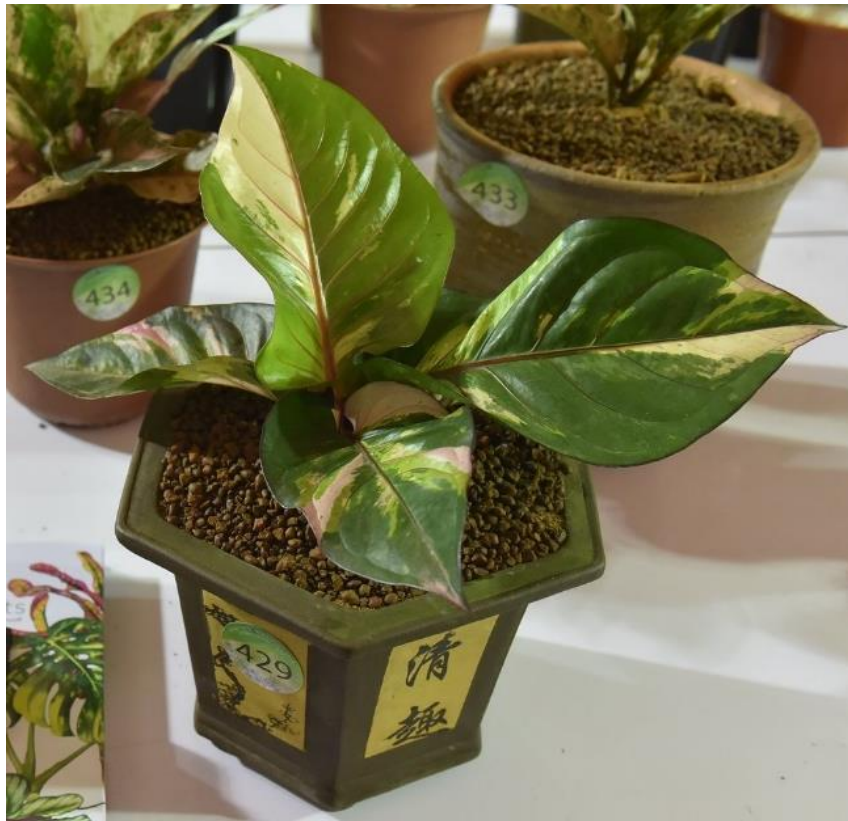
หน้าวัวใบพันธุ์สยามไทเกอร์ (Siam Tiger)