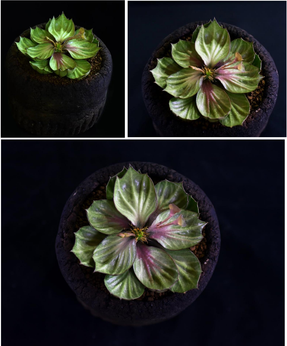
ยูโฟรเบียลูกผสมพันธุ์ขอ (Khor)