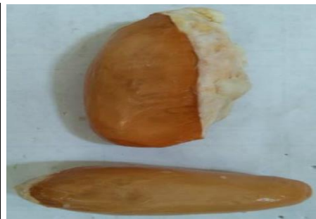
ทุเรียนพันธุ์ทองภูเขาตา