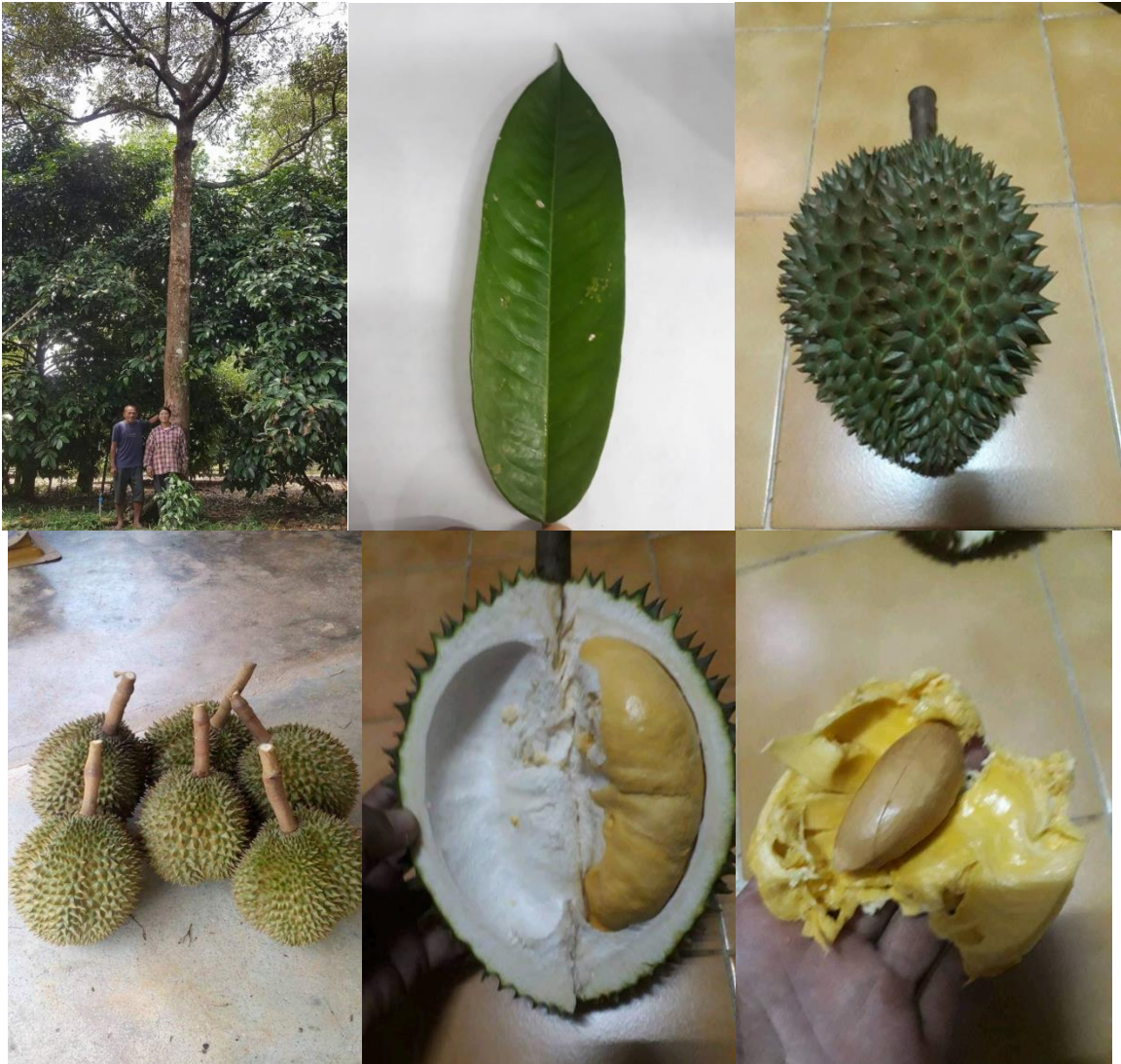
ทุเรียนพันธุ์เพียงพร