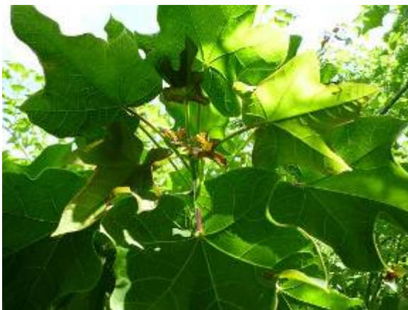
การเรียงตัวของใบ

ก้านใบ (petiole) : เมื่อยังเป็นช่อดอกอ่อนมีสีเขียวปนแดงเมื่อเริ่มแก่สีเขียว