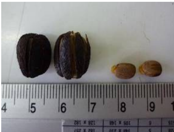
ผล - เมล็ดสบู่แดงพื้นบ้าน (ต้นพ่อ)