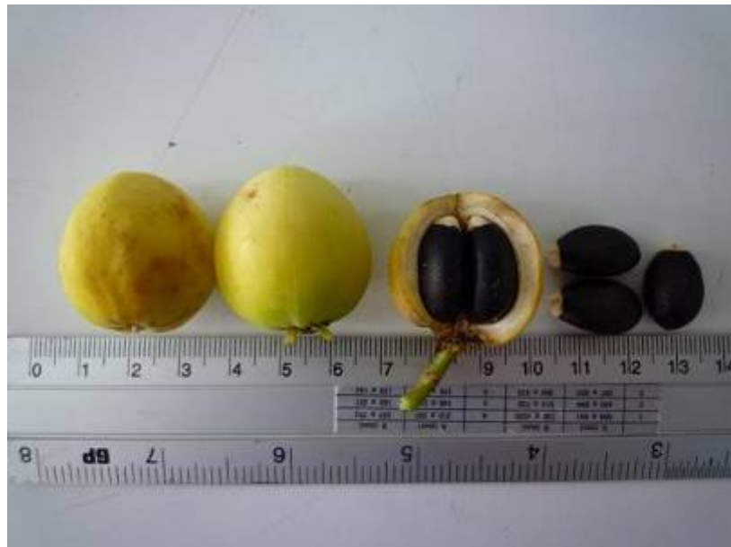
สบู่ดำลูกผสม (ข้ามชนิด) พันธุ์พีชัย 4

ภาพเปรียบเทียบความแตกต่างระหว่างสบู่แดง สบู่ดำ และสบู่ดำลูกผสม (ข้ามชนิด) พันธุ์พีชัย 4