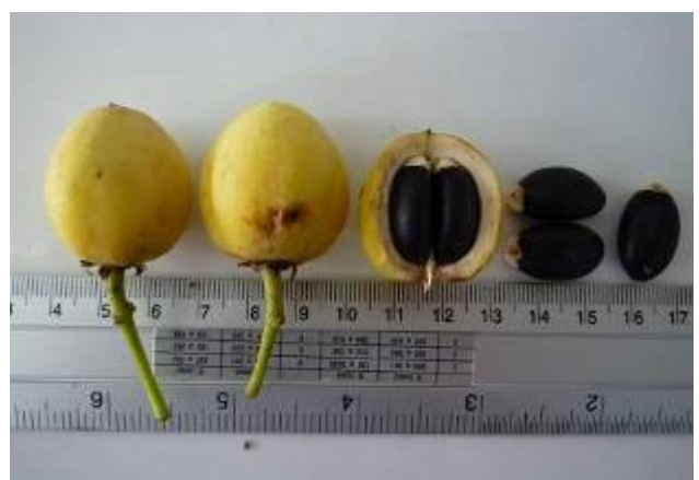
ผล - เมล็ดสบู่ดำพื้นบ้าน (ต้นแม่)