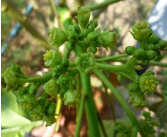
ลักษณะช่อดอก