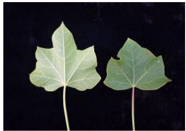
ผิวใบบน- ผิวใบล่าง

ดอก/ช่อดอก ช่อดอกแบบกระจุกแยกแขนง (panicle cyme) ประกอบด้วยดอกตัวผู้และดอกตัวเมียในช่อเดียวกัน