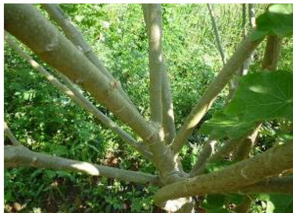
การแตกกิ่ง