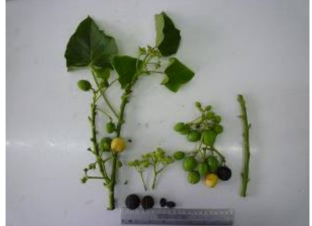
สบู่ดำพันธุ์พื้นบ้าน (ต้นแม่)