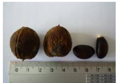
ผลแห้ง- เมล็ด