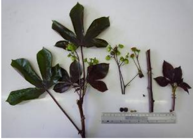
สบู่แดงพันธุ์พื้นบ้าน (ต้นพ่อ)