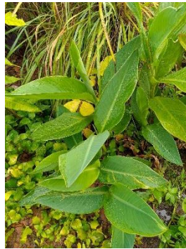
ภาพที่ 1 ลักษณะทางพฤกษศาสตร์ของพุทธรักษาพันธุ์แม่