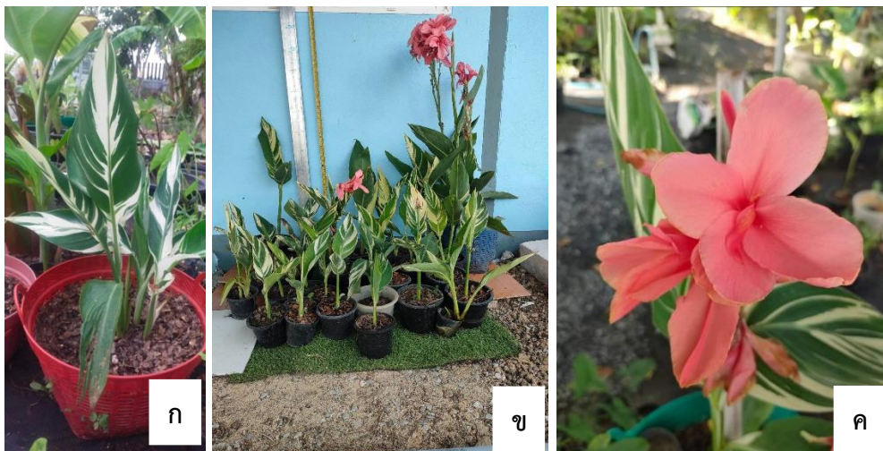
ภาพที่ 2 ลักษณะทางพฤกษศาสตร์ของพุทธรักษาพันธุ์กรีนคลีน