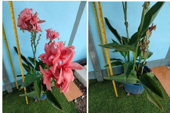
ภาพที่ 1 ลักษณะทางพฤกษศาสตร์ของพุทธรักษาพันธุ์แม่

ผล/เมล็ด ผลแบบแคปซูล กว้าง 2 เซนติเมตร ยาว 3 เซนติเมตร สีเขียว เมื่อผลแห้งจะแตก ภายในมี ไม่มีเมล็ด