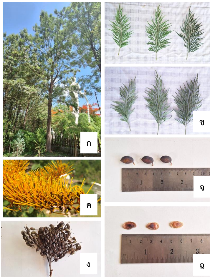
ภาพ ลักษณะทางพฤกษศาสตร์ของซิลเวอร์ไอ้คัพพัญ์ซิลเวอร์ เวฟ เอวา 1

ผล/เมล็ด ผลเดี่ยว ยาวเฉลี่ย 1.3 เซนติเมตร เส้นผ่านศูนย์กลางเฉลี่ย 0.72 เซนติเมตร (วัดส่วนที่กว้างที่สุด) เปลือกผลสุกสีน้ำตาล ผิวเรียบ ก้านผลยาวเฉลี่ย 1.9 เซนติเมตร