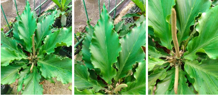
ภาพที่ 2 หน้าวัวพันธุ์เจ้าสัว (พันธุ์แม่)