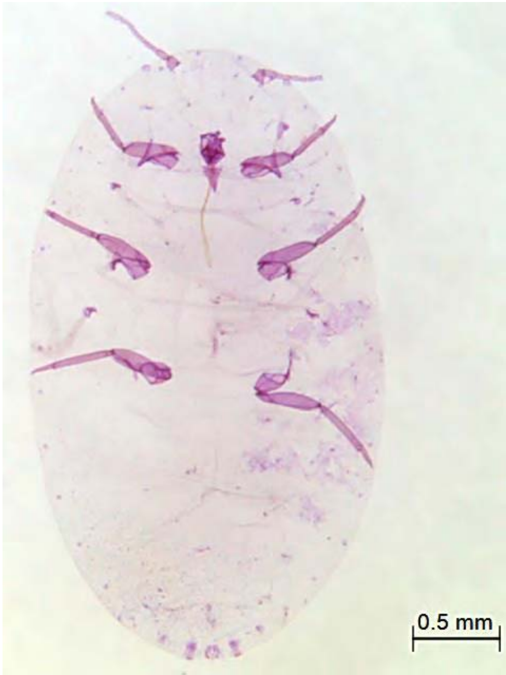
ภาพที่ 15 ลักษณะบนแผ่นสไลด์เพื่อย้ายแมงมันสำปะหลังสีเทา, Pseudococcus jackbeardsleyi Gimple & Miller