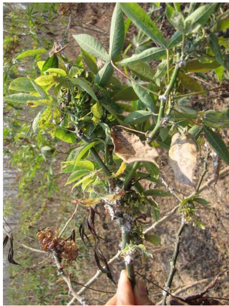
ภาพที่ 16 ลักษณะในธรรมชาติเพลี้ยแป้งมันสำปะหลังสีเทา, Pseudococcus jackbeardsleyi Gimple & Miller