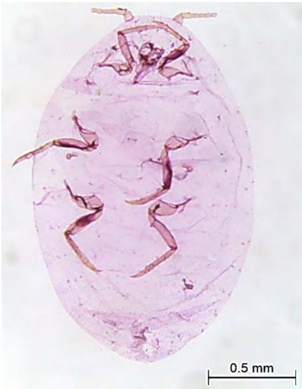
ภาพที่ 19 ลักษณะบนแผ่นสไลด์เพ็ลี้ยแป้งมะละกอ, Paracoccus marginatus Williams & Granara de Willink