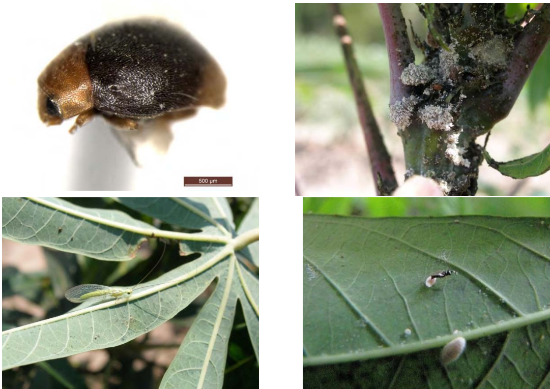
ภาพที่ 22 แมลงศัตรูธรรมชาติ (ต่อ)

ช ตัวงเต่าสคิมนัส, Scymnus rectoides Sasaji (Coleoptera: Coccinellidae)