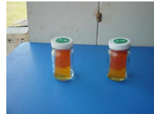
ภาพที่ 4 นำแผ่นตรวจสอบใส่ในขวดแยกสาร