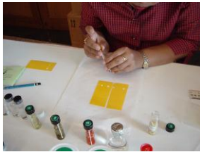
ภาพที่ 3 การหยดสารพิษลงบนแผ่นตรวจสอบ