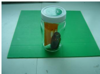
ภาพที่ 5 การทำให้เห็นจุดสารพิษชัดเจนยิ่งขึ้น