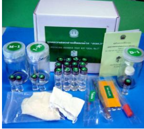
ภาพที่ 1 ชุดตรวจสอบอีไรออน คลอไพริฟอส และโอมेटโรเอท