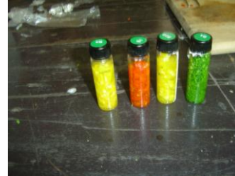
ภาพที่ 2 ตัวอย่างผักพร้อมตรวจสอบ