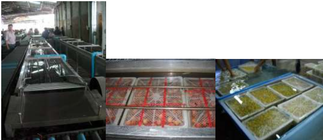
ภาพที่ 3 เครื่องลดอุณหภูมิลิ้นจี่ และถังพลาสติกแช่ลิ้นจี่

- การทดสอบการรมและการสุ่มเก็บตัวอย่างลิ้นจี่จำนวน 3 โรง ได้แก่ A B และ C พบความเข้มข้นที่ใช้รมควันเท่ากับ 0.12 0.3 และ 7% (ตารางที่ 5) พบค่าตกค้างในเนื้อหลังการรมควันเท่ากับ 53.05, 0.9 และ 361.04 ppm และในเปลือกผลหลังรมพบค่า 2,072.97, 1,218.54 และ 3,534.64 ppm พบว่าโรงรม A มีความเหมาะสมที่สุดค่าตกค้างเกินมาตรฐาน Codex เล็กน้อยเนื่องแช่น้ำหลังรม \text{SO}_2 จึงซึมเข้าเนื้อได้ แต่มีคุณภาพผลที่ดีเมื่อเปรียบเทียบกับโรงรม B และ C และค่าตกค้างในเนื้อผลและเปลือกต่ำกว่า 10 ppm และ 350 ppm เมื่อเก็บรักษานาน 30 วัน ส่วนโรงรม C รมในอัตราสูงเกินไปเท่ากับ 7.0% ตามลำดับ มีผลทำให้เนื้อมีคุณภาพระหว่างวางจำหน่ายลดลง ค่าตกค้างของ \text{SO}_2 ในเนื้อและเปลือกขึ้นอยู่กับปัจจัยต่างๆ ได้แก่ ผลลิ้นจี่ที่ใช้ อัตราส่วนที่วางในห้องรม ความเข้มข้น เวลาที่ใช้รม และการดูดซับ การเป่าระบายแก๊ส อุณหภูมิและความชื้นสัมพัทธ์ระหว่างการเก็บรักษา ซึ่งต้องควบคุมปัจจัยที่เกี่ยวข้องให้ถูกต้องจึงจะควบคุมความแปรปรวนและค่าตกค้างไม่เกินมาตรฐาน Codex