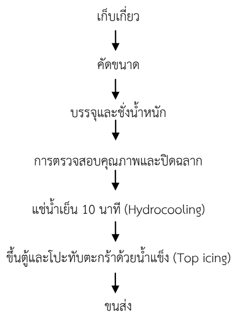
ภาพที่ 1 การลดอุณหภูมิด้วยน้ำเย็น (Hydrocooling)

ในขั้นตอนการยืดอายุสั้นจี้โดยการใช้น้ำเย็นผสมน้ำแข็ง (ภาพที่ 1) ควรทำภายใน 3-6 ชั่วโมงหลังการเก็บเกี่ยว มีการใช้สองรูปแบบคือรางเลื่อน 73.3 เปอร์เซ็นต์ และ ถังสำหรับจุ่ม 26.7 เปอร์เซ็นต์ โดยใช้น้ำประปา 26.7 เปอร์เซ็นต์ น้ำจากแหล่งธรรมชาติ เช่น น้ำคลอง น้ำบาดาล 73.3 เปอร์เซ็นต์ และมีผู้ประกอบการที่ผสมสารเคมีจำพวก ฆ่าเชื้อรา เช่น คาร์เบนดาซิม และ สารจับใบลงในน้ำที่ใช้ คิดเป็น 60 เปอร์เซ็นต์ บางโรงคัดบรรจุใช้ ozone ฆ่าเชื้อในระบบน้ำล้างทำให้อาจจะลดการปนเปื้อนได้ สรุปเทคนิคที่ใช้ 2 แบบ คือ ผู้ประกอบการนำผลผลิตแช่ในน้ำเย็นทันที 15 บริษัท และอีก 1 บริษัท ทำการล้างก่อนด้วยน้ำสะอาดฆ่าเชื้อด้วย ozone 2 นาที ต่อมาจึงนำมาลดอุณหภูมิด้วยน้ำเย็น