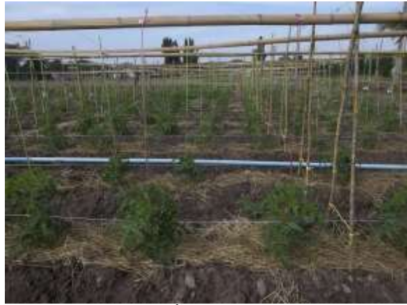
ภาพผนวกที่ 6 การทำค้างมะเขือเทศตามลักษณะการเจริญเติบโตแบบทอดเลื้อยของมะเขือเทศกลุ่มเซอร์รี่