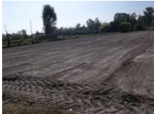
ภาพผนวกที่ 1 การเตรียมแปลงก่อนปลูกมะเขือเทศใหม่จะปลูกปอเทืองเพื่อตัดวงจรชีวิตของไส้เดือนฝอย