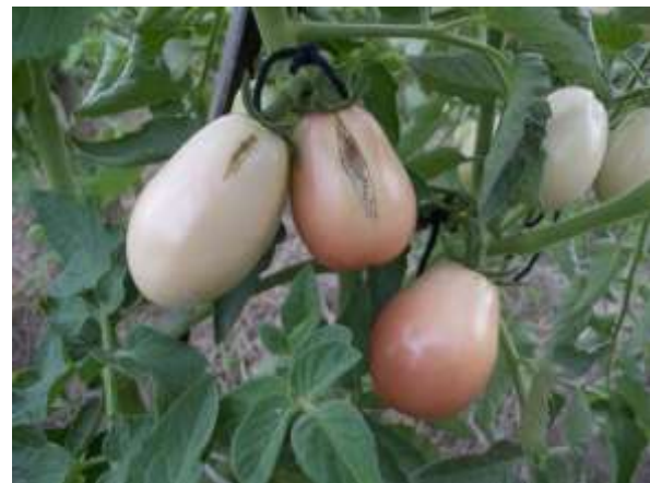
ภาพผนวกที่ 7 ผลมะเขือเทศแตกได้ง่ายในการปลูกช่วงฤดูฝน