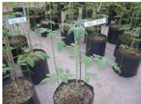
ภาพผนวกที่ 11 ต้นมะเขือเทศปลูกในโรงเรือน ที่อายุ 30 วันหลังเพาะเมล็ด