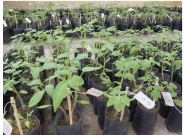
ภาพผนวกที่ 3 ต้นกล้ามะเขือเทศที่อายุ 10 วันหลังเพาะเมล็ด ซึ่งพร้อมที่จะย้ายปลูกลงถุงเพาะชำขนาดใหญ่ สำหรับการปลูกในโรงเรือน