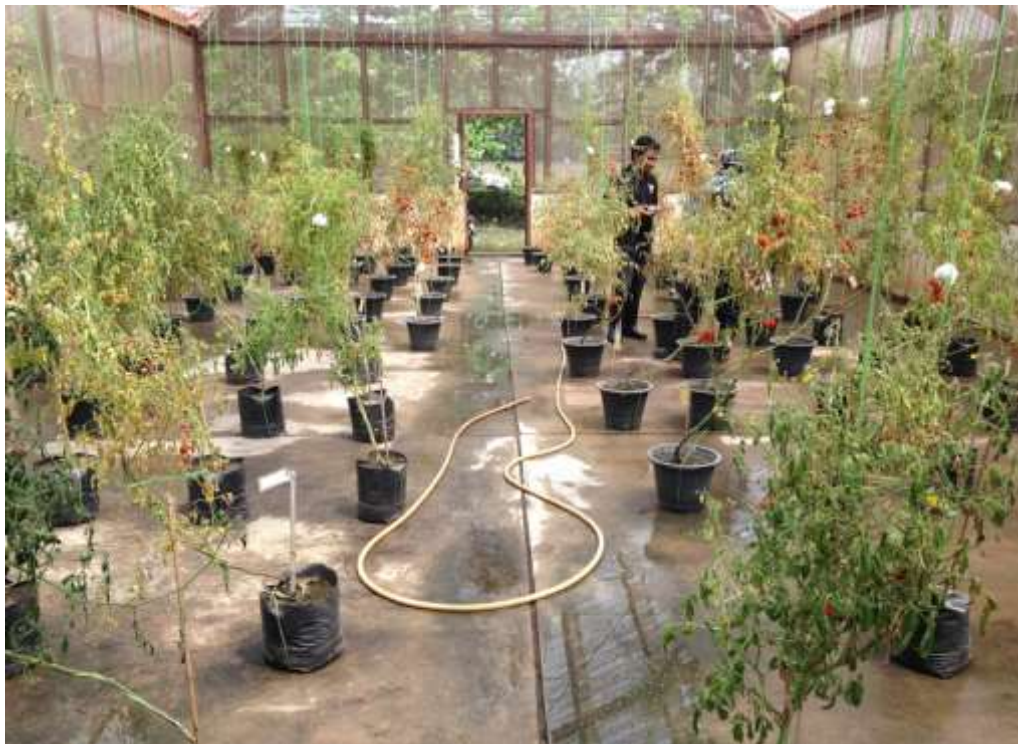
ภาพผนวกที่ 16 ต้นมะเขือเทศที่คัดเลือกปลูกในโรงเรือนและทำการผสมเกสรเพื่อนำไปทดสอบสมรรถนะการรวมตัวเฉพาะ (SCA) หลังจากน้ำท่วมในโรงเรือนสูง 0.5 เมตร เป็นเวลา 10 วัน ต้นเดือนตุลาคม 2556