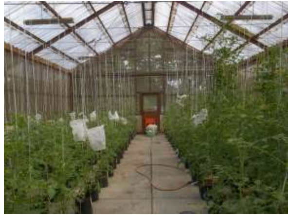
ภาพผนวกที่ 12 ต้นมะเขือเทศปลูกในโรงเรือน ทำการผสมเกสรระหว่างเบอร์ เพื่อเตรียมเมล็ดพันธุ์ใช้ทดสอบสมรรถนะการรวมตัวเฉพาะ (SCA) มีอุณหภูมิระหว่างผสมเกสรค่อนข้างสูง ที่กลางวันเฉลี่ย 36.45 องศาเซลเซียส และกลางคืนเฉลี่ย 29.41 องศาเซลเซียส