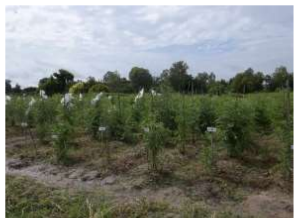
ภาพผนวกที่ 5 การปลูกมะเขือเทศในแปลงช่วงฤดูฝน (ซ้าย) และการผสมตัวเองของต้นที่คัดเลือก (ขวา)