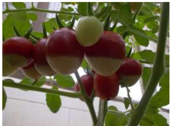
ภาพผนวกที่ 14 กลีบดอกมะเขือเทศไม่ร่วงและรัดผลอ่อนทำให้ผลมีรูปร่างผิดปกติจากลักษณะประจำพันธุ์ (ซ้าย) และอาการผลขาดแคลเซียม (ขวา) โดยจะแสดงอาการบริเวณส่วนปลายของผล