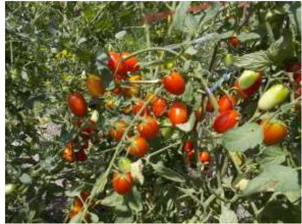
ภาพผนวกที่ 9 มะเขือเทศกลุ่มสีดา (ซ้าย) และ กลุ่มเซอร์รี่ (ขวา) ที่สามารถให้ผลผลิตได้ดีในการปลูกช่วงฤดูฝน