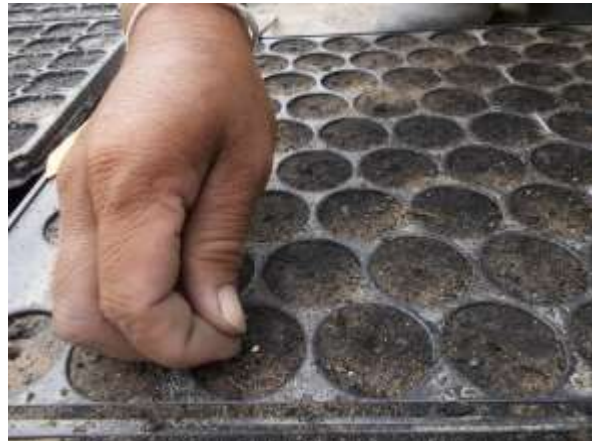
ภาพผนวกที่ 2 การเพาะเมล็ดมะเขือเทศเบอร์ที่คัดเลือก เบอร์ละ 10 ต้น