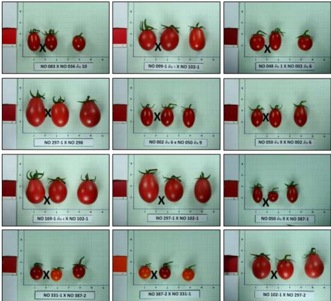
ภาพผนวกที่ 18 คู่ผสมทดสอบสมรรถนะการรวมตัวเฉพาะ (SCA) ของมะเขือเทศเบอร์ที่มีลักษณะทางการเกษตรดี