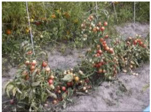
ภาพผนวกที่ 10 มะเขือเทศกลุ่มสีดาที่มีใบปกคลุมขณะผลสุกจะมีผลสีเข้ม (#183) และใบเหี่ยวแห้งขณะผลสุกผลจะโดนแดดทำให้สีซีดขาว (#169-1-4)