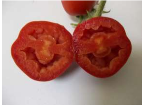
ภาพผนวกที่ 15 การปลูกมะเขือเทศในโรงเรือนมักพบผลมะเขือเทศที่มีเมล็ดลีบในกลุ่มเซอร์รี่ (ซ้าย) และผลที่ไม่สร้างเมล็ดในกลุ่มแปรรูป (ขวา)