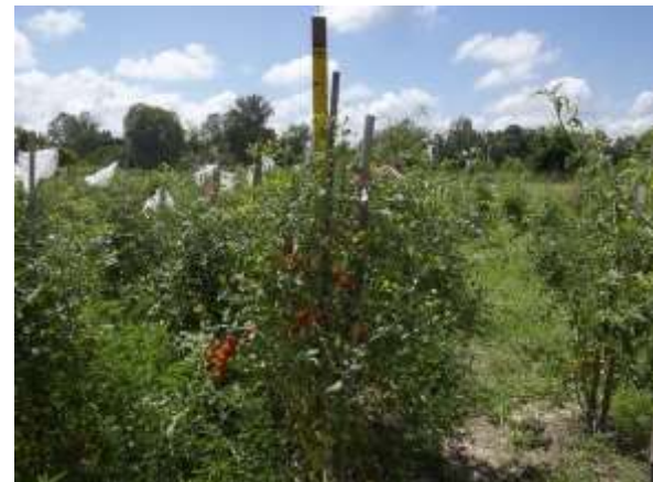
ภาพผนวกที่ 8 มะเขือเทศกลุ่มสีดา (ซ้าย) และ กลุ่มเซอร์รี่ (ขวา) ที่สามารถให้ผลผลิตได้ดีในการปลูกช่วงฤดูฝน