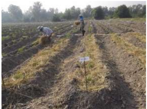
ภาพผนวกที่ 4 การทำคันดินเพื่อกลบปุ๋ย ครั้งที่ 1 และคลุมฟางข้าวแห้งเพื่อกำจัดวัชพืช รักษาความชื้นในดิน