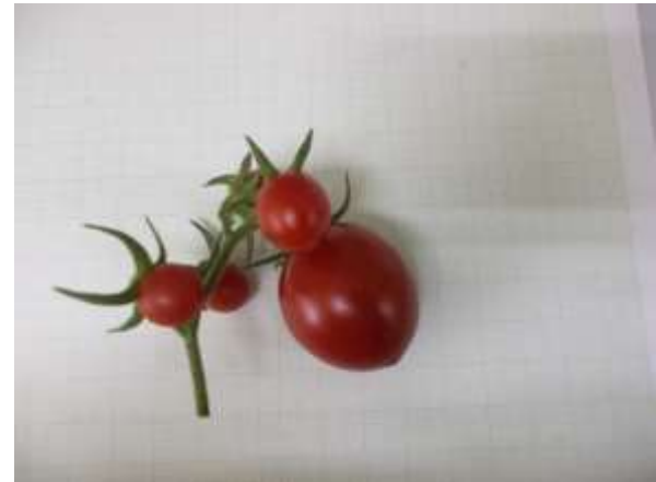
ภาพผนวกที่ 13 มะเขือเทศกลุ่มเซอร์รี่มักแสดงอาการมีจำนวนดอกต่อช่อมากแต่มีเปอร์เซ็นต์การติดผลน้อย (ซ้าย) หรือจำนวนผลที่สมบูรณ์ในช่อน้อย (ขวา)