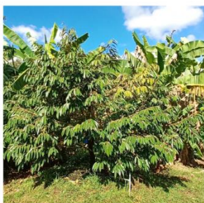
ก่อนทดสอบ พ.ย.62