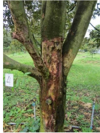
ภาพที่ 2 : อาการลำต้นและกิ่งเน่า