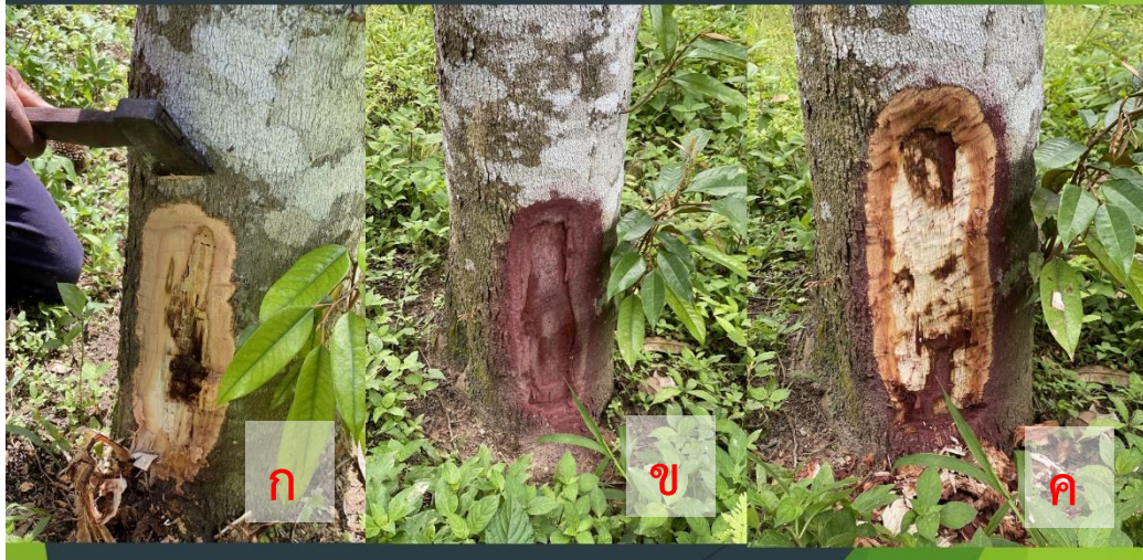
ภาพที่ 21 ผลการใช้น้ำเห็ดเรืองแสงสตรีนรัศมีทาแผลต้นทุเรียน