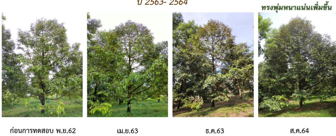
ภาพที่ 15 ภาพต้นทุเรียน จ.ตราด ได้รับการฟื้นฟูระบบราก ต้นสมบูรณ์มีปริมาณใบหนาแน่นขึ้น