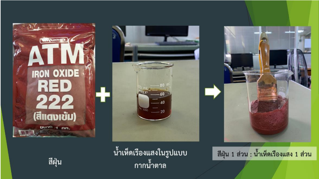
ภาพที่ 20 การผสมน้ำเห็ดเรืองแสงสีรินรัศมีกับสีฝุ่นเพื่อใช้ทาแผล