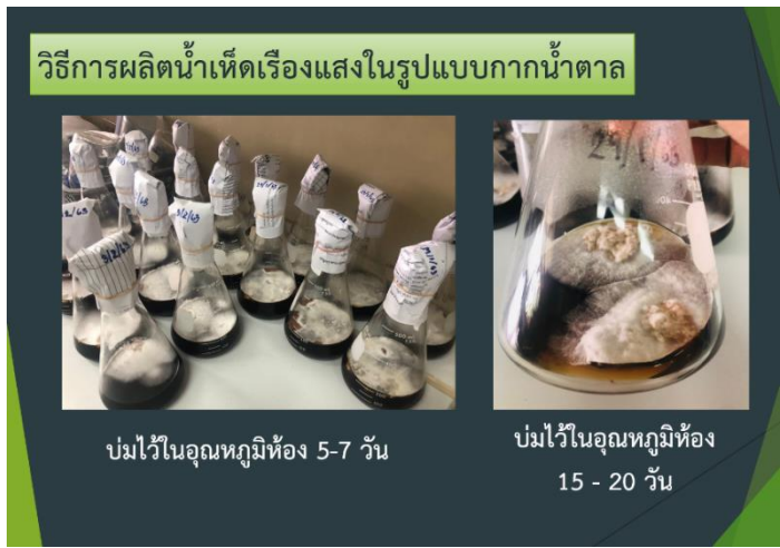
ภาพที่ 19 การผลิตน้ำเห็ดเรืองแสงสีรินรัศมี