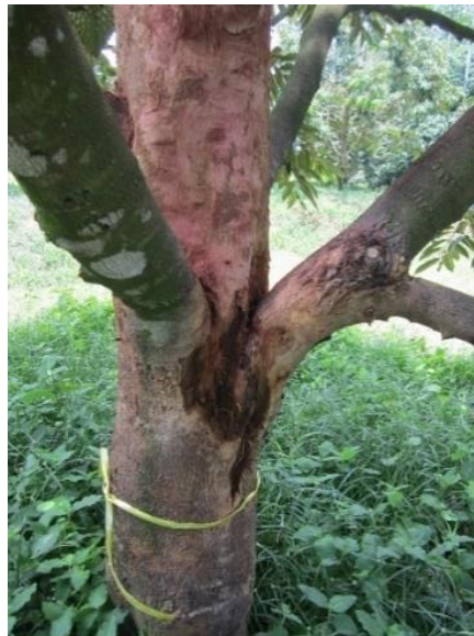
ภาพที่ 7 อาการลำต้นและกิ่งเน่า

2) กลุ่มอาการที่พบแผลโคนต้น หากสังเกตพบแผลตั้งแต่เริ่มอาการ ขูดและทาแผลด้วยสารเคมีและเชื้อราไตรโคเดอร์มา รักษาต่อเนื่องได้ทันอาการจะไม่ลุกลาม สามารถรักษาให้หายได้ แต่หากสังเกตพบอาการได้ช้า แผลลามใหญ่หรือลามรอบโคนต้น โคนกิ่ง จะรักษาได้ยาก คำแนะนำสำหรับกลุ่มนี้คือการราดสารเคมี 1 - 2 ครั้ง ฟันปุระบรอกด้วยเชื้อราไตรโคเดอร์มา กรดฮิวมิก และปุ๋ยเกล็ดสูตรตัวกลางสูง เช่น 20-20-20 หรือ 15-30-15 ที่มีธาตุรองธาตุเสริมร่วมด้วย เพื่อกระตุ้นการสร้างรากใหม่ ร่วมกับการขูดทาแผลด้วยสารเคมีหรือเชื้อราไตรโคเดอร์มาต่อเนื่องทุกเดือน รวมถึงการพ่นสารเคมีกำจัดมอด เนื่องจากอาการแผลที่ลำต้นและกิ่ง มักมีอาการของมอดร่วมด้วย