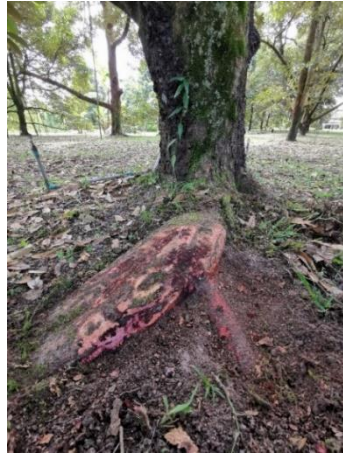
ภาพที่ 1 : อาการรากเน่า