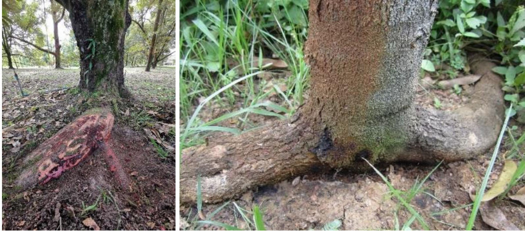
ภาพที่ 6 อาการรากเน่าและเน่าคอดิน

2) กลุ่มอาการที่พบแผลโคนต้น หากสังเกตพบแผลตั้งแต่เริ่มอาการ ขูดและทาแผลด้วยสารเคมีและเชื้อราไตรโคเดอร์มา รักษาต่อเนื่องได้ทันอาการจะไม่ลุกลาม สามารถรักษาให้หายได้ แต่หากสังเกตพบอาการได้ช้า แผลลามใหญ่หรือลามรอบโคนต้น โคนกิ่ง จะรักษาได้ยาก คำแนะนำสำหรับกลุ่มนี้คือการราดสารเคมี 1 - 2 ครั้ง ฟันปุระบรอกด้วยเชื้อราไตรโคเดอร์มา กรดฮิวมิก และปุ๋ยเกล็ดสูตรตัวกลางสูง เช่น 20-20-20 หรือ 15-30-15 ที่มีธาตุรองธาตุเสริมร่วมด้วย เพื่อกระตุ้นการสร้างรากใหม่ ร่วมกับการขูดทาแผลด้วยสารเคมีหรือเชื้อราไตรโคเดอร์มาต่อเนื่องทุกเดือน รวมถึงการพ่นสารเคมีกำจัดมอด เนื่องจากอาการแผลที่ลำต้นและกิ่ง มักมีอาการของมอดร่วมด้วย