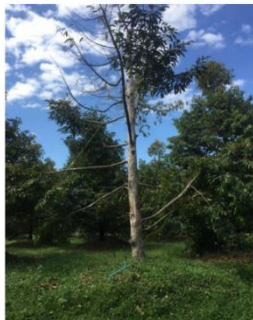
ก่อนทดสอบ ม.ค.63