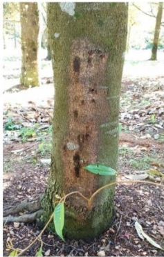
ก่อนทดสอบ ธ.ค. 62