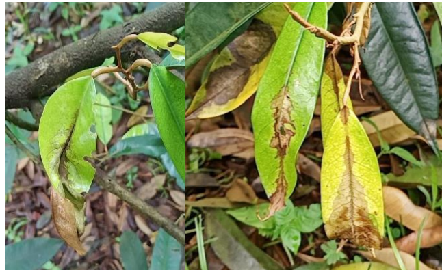
ภาพที่ 3 : รุพารูที่กิ่งที่เกิดจากการเข้าทำลายของมอด