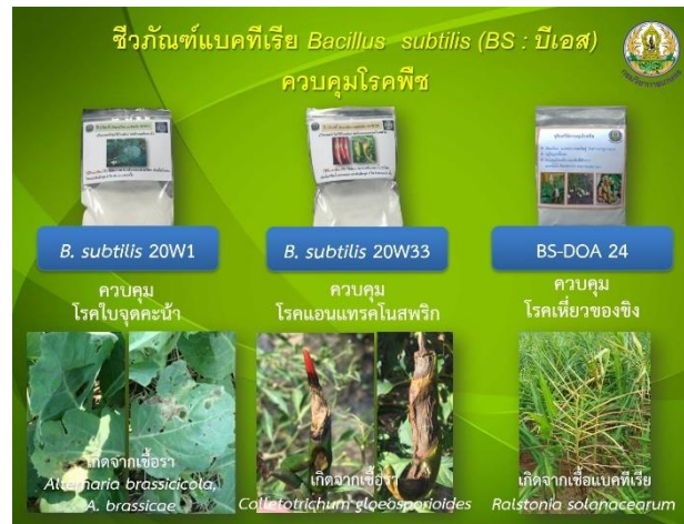
ภาพที่ 22 ชีวภัณฑ์ Bacillus subtilis (บีเอส) เพื่อควบคุมโรคพืช โดยกรมวิชาการเกษตร

กรมวิชาการเกษตร โดยนลินีและคณะ (2556) ได้ค้นพบแบคทีเรีย Bacillus subtilis ที่มีประสิทธิภาพในการควบคุมโรครากเน่าโคนเน่าของทุเรียนที่เกิดจากเชื้อรา Phytophthora palmivora โดยชีวภัณฑ์ B. subtilis สายพันธุ์ 5102 สามารถรักษาโรครากเน่าโคนเน่าของทุเรียน โดยการลอกเปลือกต้นทุเรียนบริเวณที่เป็นโรคและทาด้วยชีวภัณฑ์ B. subtilis สายพันธุ์ 5102 จำนวน 4 ครั้ง และใช้เข็มฉีดยาชีวภัณฑ์ดังกล่าวในต้นทุเรียนจำนวน 1 ครั้ง เป็นที่น่าเสียดายที่ไม่มีการพัฒนาต่อยอดขยายผลในสายพันธุ์ดังกล่าว แต่ยังคงมีงานวิจัยพัฒนาชีวภัณฑ์ B. subtilis สายพันธุ์อื่นๆ ในรูปแบบผงเชื้อ ได้แก่ 20W1 ควบคุมโรคใบจุดคาน้ำ 20W33 ควบคุมโรคแอนแทรกโนสพริก และ BS-DOA24 ควบคุมโรคเหี่ยวในขิง