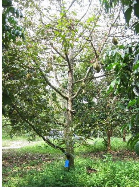
ภาพที่ 9 อาการรากเน่า

จากการสังเกตลักษณะอาการของโรคที่พบความหลากหลาย การปฏิบัติงานเพื่อรักษาโรคในแต่ละกรณีมีรายละเอียดที่ต่างกัน แต่ในทุกกรณีที่มีวิจัยให้ความสำคัญกับการฟื้นฟูระบบราก เพื่อฟื้นฟูสภาพต้นให้แข็งแรงสู้กับเชื้อโรค จึงตัดสินใจเริ่มต้นการรักษาโรคอย่างยั่งยืนโดยการวิเคราะห์ความสมบูรณ์ของดิน ก่อนดำเนินการฟื้นฟูระบบราก เพื่อทราบค่าความเป็นกรด-ด่างของดิน ปริมาณอินทรีย์วัตถุ และปริมาณธาตุอาหารหลัก ให้คำแนะนำการปรับสภาพดินตามค่าวิเคราะห์ เปรียบเทียบค่าที่เหมาะสมกับการผลิตทุเรียน โดยสำนักวิจัยพัฒนาปัจจัยการผลิตทางการเกษตรได้สรุปคำแนะนำการใช้ปุ๋ยตามค่าวิเคราะห์ดินสำหรับพืชทุเรียน ดังตารางที่ 2