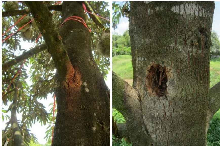
ภาพที่ 8 อาการง่ามกิ่งเน่า

3) กลุ่มอาการง่ามกิ่งเน่า มักพบอาการดังกล่าวในต้นทุเรียนอายุยังน้อยไม่เกิน 10 ปี เป็นช่วงอายุที่เริ่มให้ผลผลิต หากไม่สังเกตและรักษาโรคได้ทัน ต้นทุเรียนจะโทรมและตายอย่างรวดเร็ว โดยมักพบอาการเน่าที่ง่ามกิ่งและลำต้น อาจสังเกตได้จากการดูภาพรวมทรงพุ่ม มักจะเห็นบางกิ่งใบเขียวซีดหรือสีเหลืองและเริ่มใบร่วงเหลือแต่ยอดแห้ง หากโคนกิ่งพบแผลลามล้อมโคนกิ่ง ควรตัดกิ่งที่เสียหายออก และฉาบทาแผลด้วยสารเคมีต่อเนื่อง กรณีที่พบอาการบนง่ามกิ่งสูง แนะนำให้ฉีดพ่นสารเคมีตามคำแนะนำต่อเนื่องให้ทั่วทรงพุ่มทุกเดือนจนกว่าแผลจะแห้ง และควรใส่ปุ๋ยหมักร่วมกับเชื้อราไตรโคเดอร์มาเพื่อเพิ่มปริมาณจุลินทรีย์ที่มีประโยชน์ช่วยลดปริมาณเชื้อโรค หรือราดทรงพุ่มด้วยเชื้อราไตรโคเดอร์มาต่อเนื่องทุก 3 เดือน ปีละ 4 ครั้ง