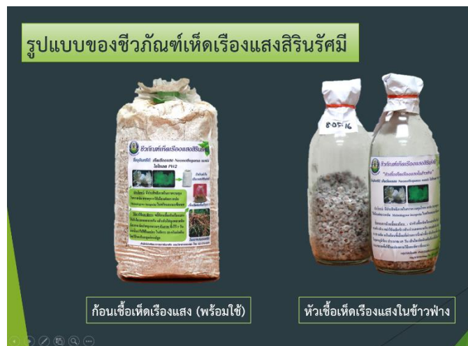
ภาพที่ 18 รูปแบบชีวภัณฑ์เห็ดเรืองแสงสิรินรัมย์