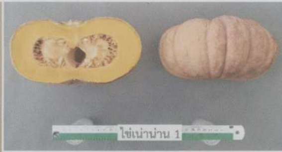
รูปร่างตัดตามยาว