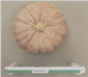
ผลสุกแก่