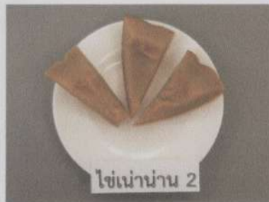
สีเนื้อนิ่งสุก