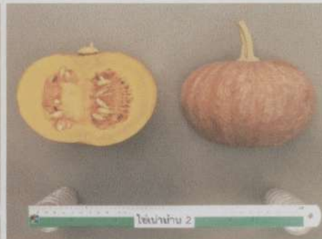
รูปร่างตัดตามยาว