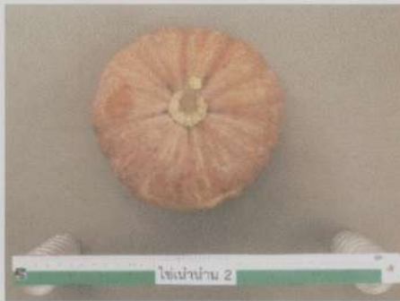
ผลสุกแก่