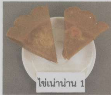
สีเนื้อนิ่งสุก